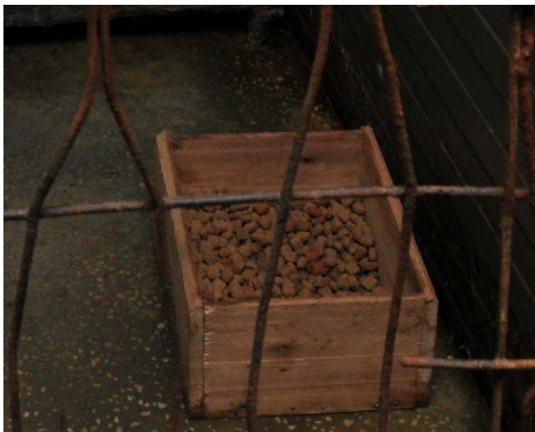
Foto 10 - boluri de lemn