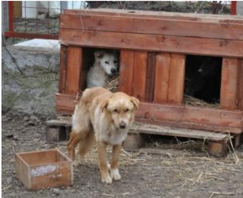
Foto 12 - câine cu probleme neurologice cazat împreună cu câini aparent sănătoși