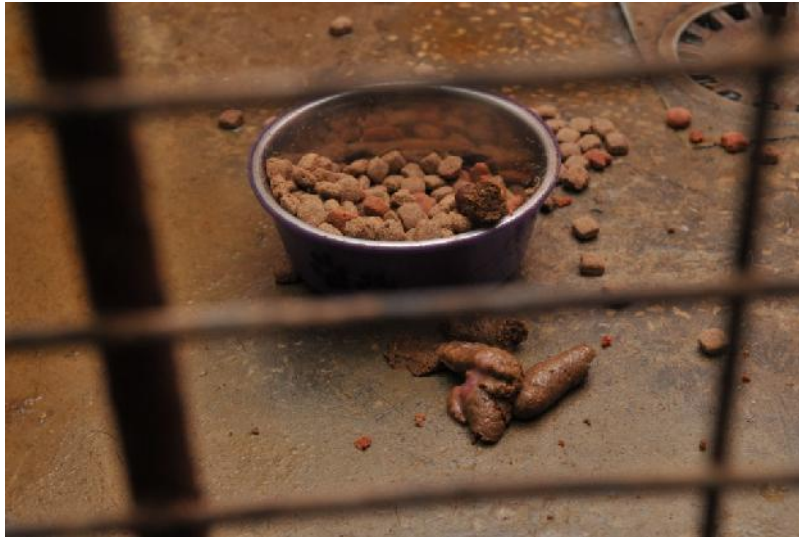
Foto 9 - boluri plasate pe podea

adresă | str. Reșița nr. 12, ap. 4 300188 Timișoara, România telefon | 0754 032 534 fax | 0256 436 516 e-mail | pet.hope.association@gmail.com website | www.pethope.ro