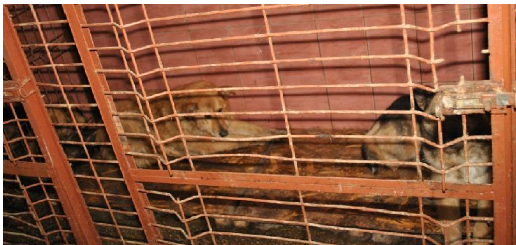
Foto 7 - boxă adăpostind câini de talie medie-mare