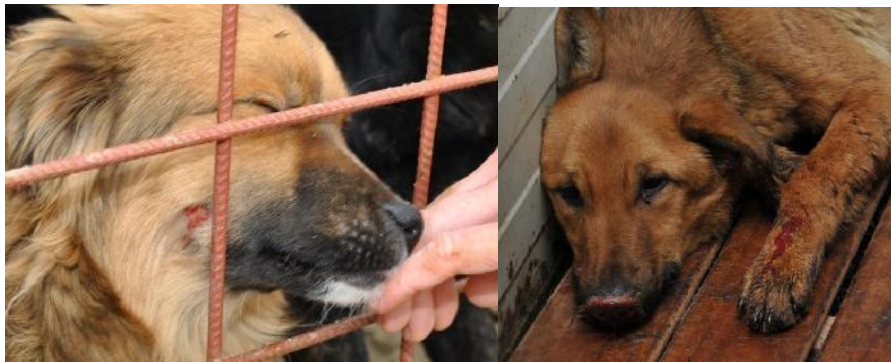
Foto 3 - câini cu răni deschise fără urme de tratament