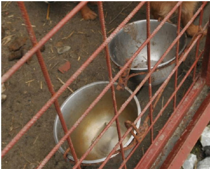
Foto 11 - boluri de apă murdare și uscate

În cadrul adăpostului public, asigurarea apei în permanență nu este corespunzătoare, chiar mai mult, nu este considerată importantă de către îngrijitorii animalelor.