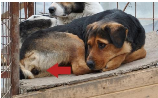
Foto 1 - mascul de necastrat 6