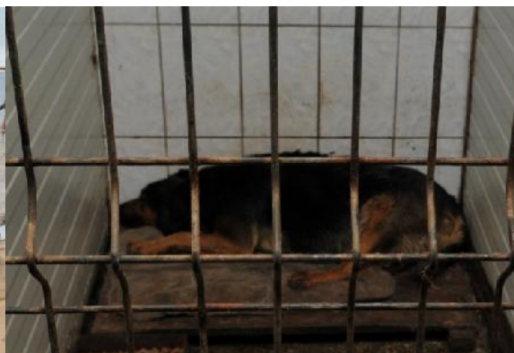
Foto 2 - femelă gestantă aproape de naștere

Conform spuselor medicului veterinar al adăpostului, a poziției oficiale a adăpostului public și a observațiilor persoanelor prezente în data de 13 februarie 2013, până la momentul vizitei noastre de lucru, în adăpostul public nu s-a practicat sterilizarea. Femelele și masculii erau cazați împreună "intacți", existând astfel probabilitatea, și uneori certitudinea, montării animalelor în adăpost. Ulterior datei de 13 februarie 2013, serviciul de ecarisaj a insistat ca în cadrul protocolului cu Facultatea de Medicină Veterinară, să fie sterilizate animalele din adăpost, prioritar față de cele capturate de pe stradă, în ciuda recomandărilor Pet Hope care a subliniat în repetate rânduri că exemplarele din adăpost sunt mai vulnerabile din punct de vedere medical, iar montarea lor poate fi prevenită temporar printr-un triaj și o cazare în funcție de sexul animalelor.