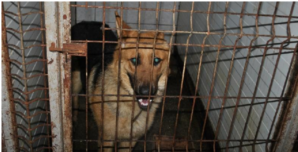
Foto 6 - boxă adăpostind un câine de talie mare