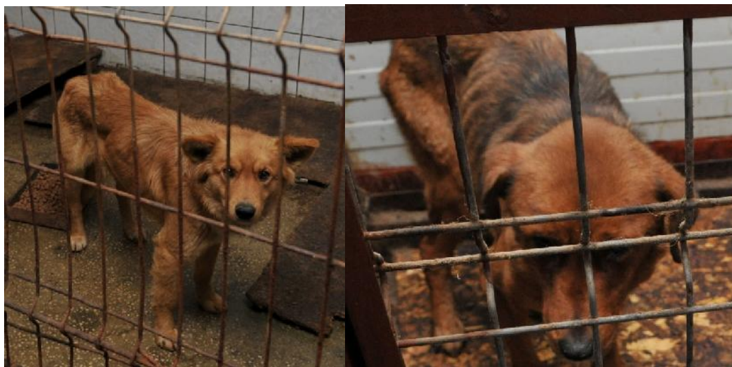
Foto 8 - câini emaciați